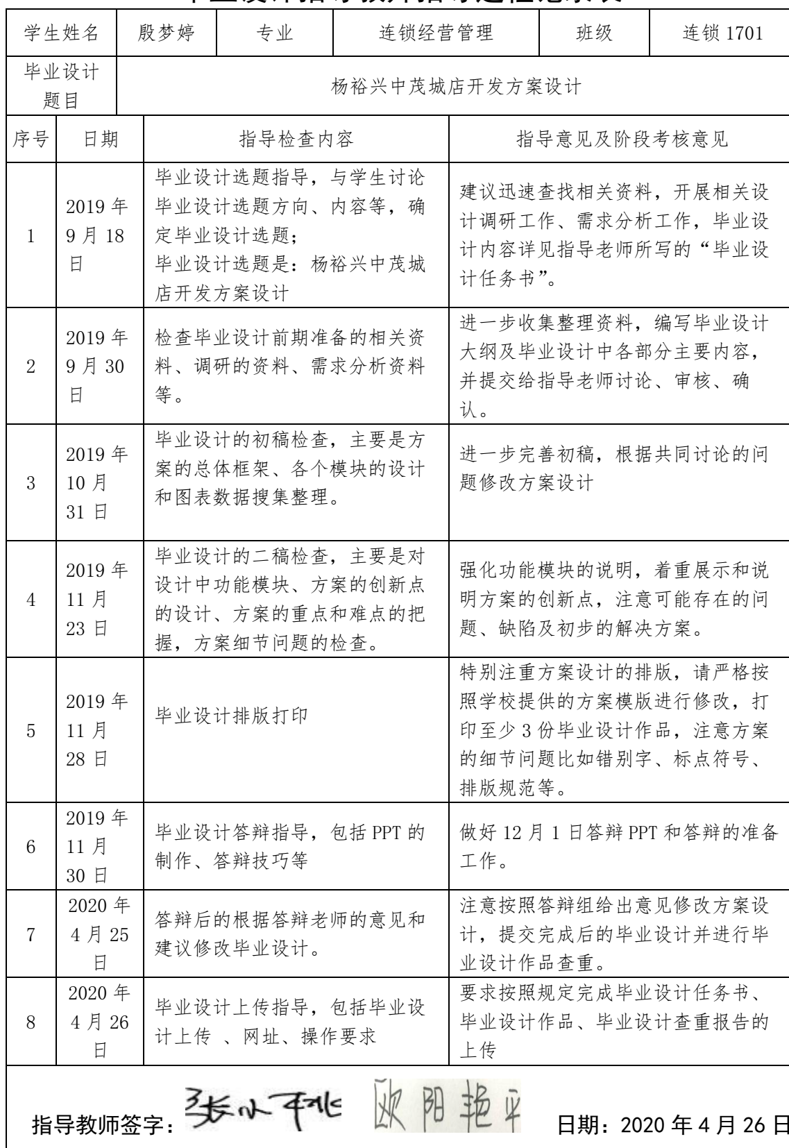
毕业设计指导教师指导过程记录表